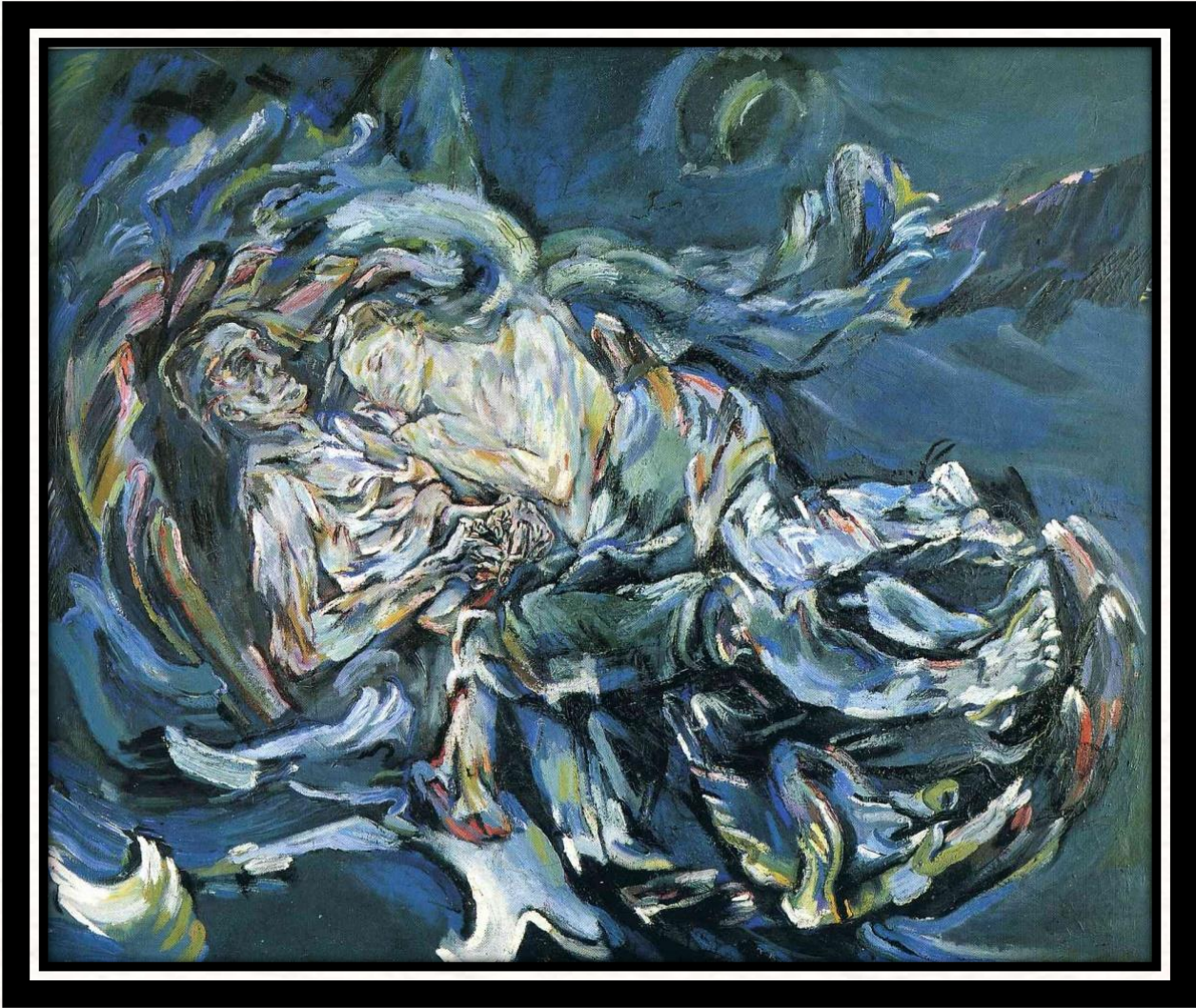
The bride of the wind , 1913 fait par Oscar Kokoschka